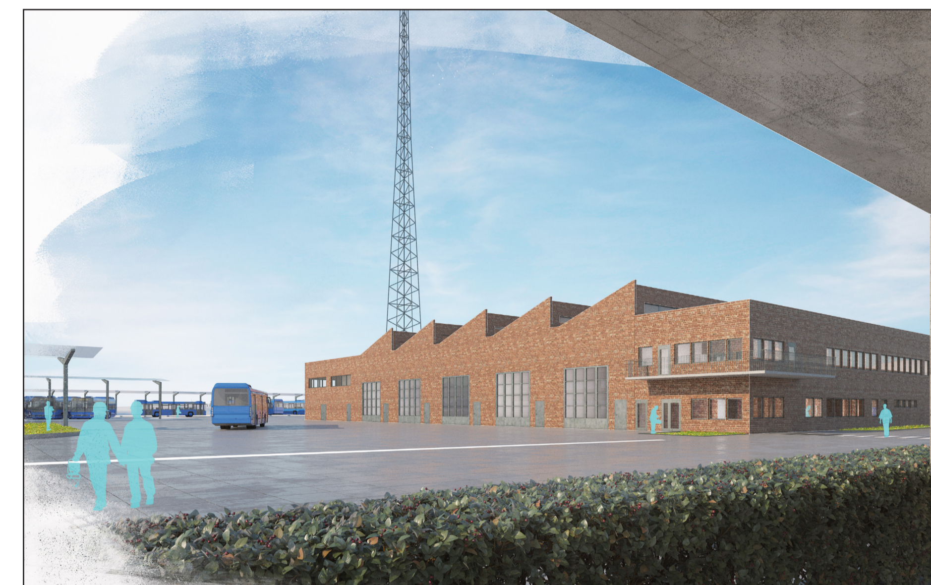
Perspektiv av bussdepå sett från nordöst. Illustration: White Arkitekter